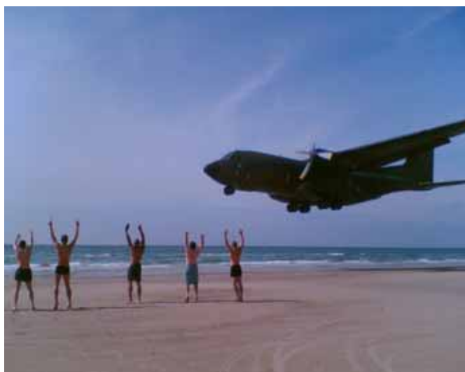
C-160 Transall simulerer en strandlanding

De der kende stranden ved Blokhuis, ved at den er bred nok til både gående og kørende trafik. Men hvad med flyvende trafik??