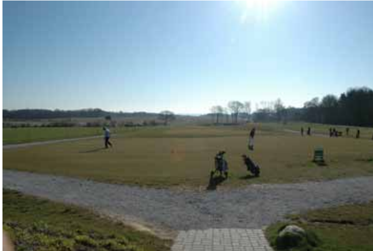
Putteområde på en forårsdag

Søndag morgen. Vejret er perfekt! Høj sol, let vind og de lover 15 grader. Planlægningen af årets første match ser ud til at lykkes. Ikke kun vejret, men også banen - Nørhald Golfklub ved Randers - og de ni friske golfspillere, hvoraf to var helt nye medlemmer, var helt i top.