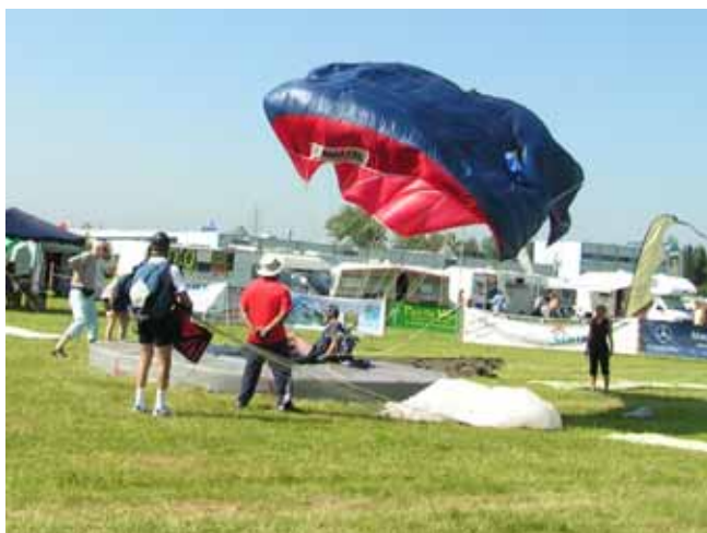
Her har jeg netop lavet 0,00m!

Det var så netop her i mit allerførste spring, at træningen måske gjorde sin ret, idét jeg lavede bedst mulig score, nemlig 0,00m!