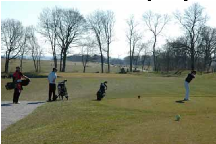
1. tee. Bliver den lige Julie?

Kl. 10:00 slog den 1. bold ud på det 138 m.(gul) lange par 3 med sø i venstre og Out of Bounds i højre. En rigtig "lækkerbiskken". Det blev vist kun til én par. Banen var på trods af den lange vinter eller rettere sagt lange kuldeperiode i fin stand. Den ligger dog højt og var derfor ret tør, hvilket resulterede i noget nær linksbane tilstande. Land bolden 20 m før green og lad den løbe ind.