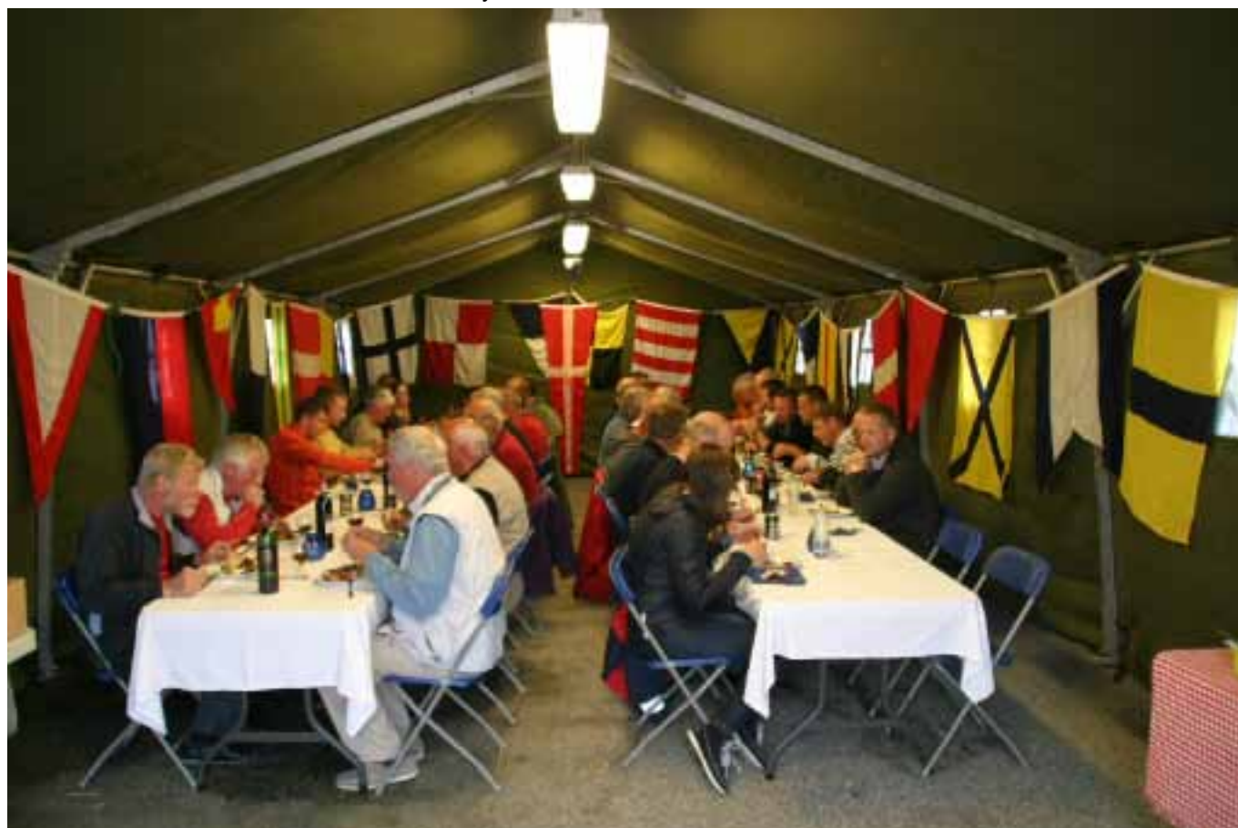
På trods af den tætte dyst kunne alle deltagere og hjælpere slappe af og hygge sammen