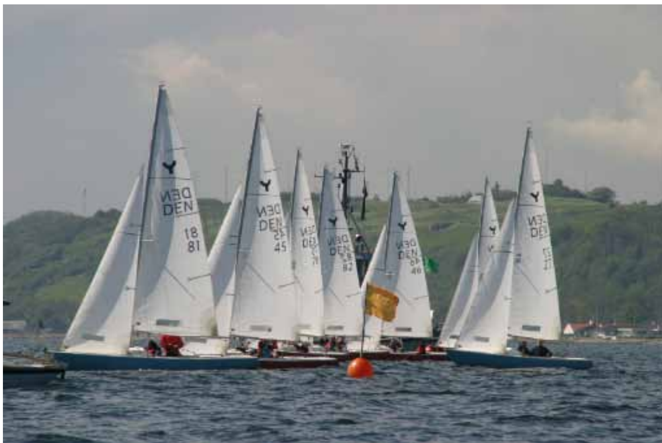
Dysten til søs kunne være tæt