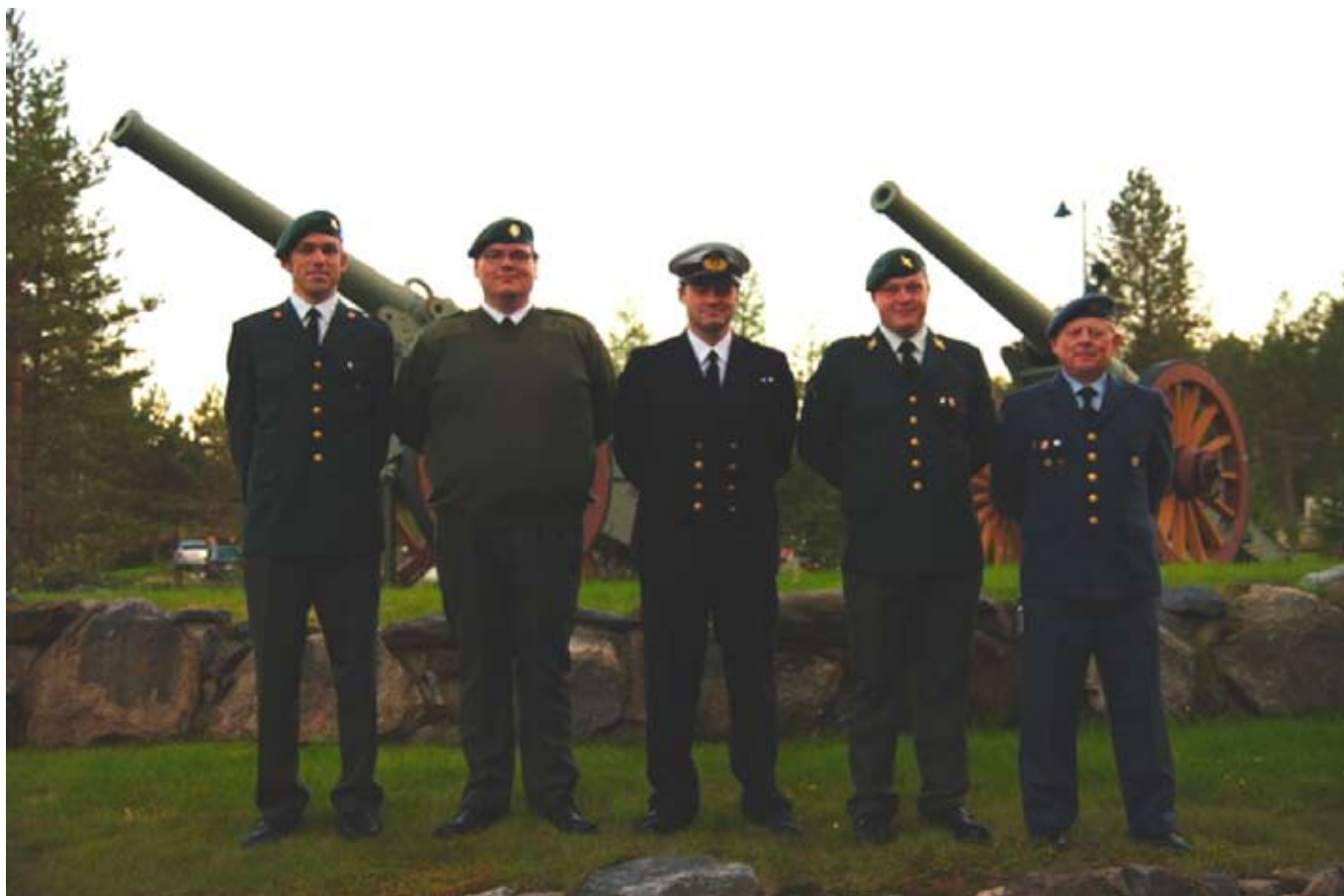
Grovpistollandshold til Nordisk Militært Mesterskab i Finland 2010

DER ER SIMELT HEN FOR FÅ SØFOLK PÅ DETTE BILLEDE